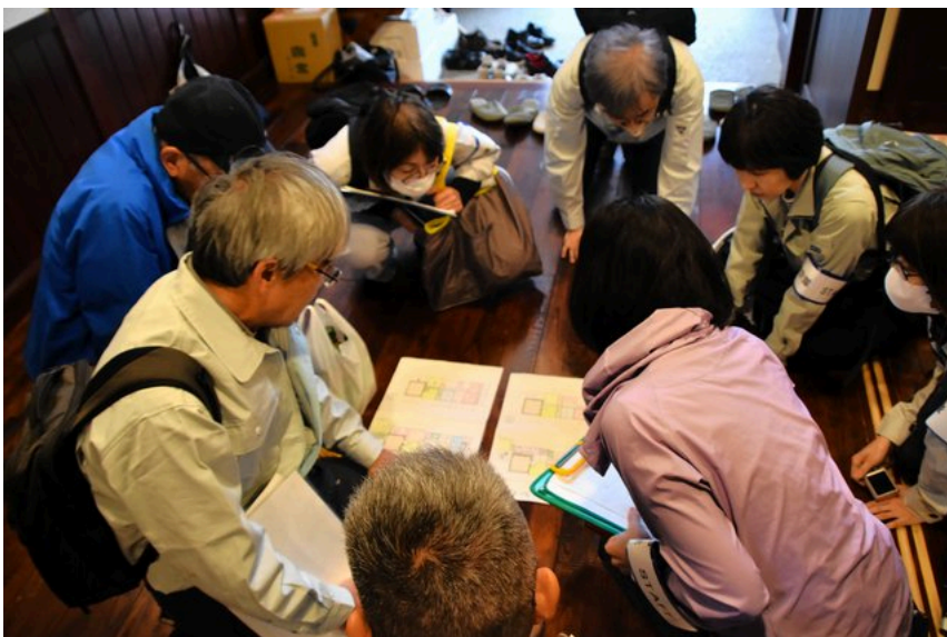
図面を囲んで検討する耐震補強の専門家ら=石川県七尾市

支えになるのは、名工大などが取り組んできた「達人塾」を通じた実務者のネットワークだ。石川県を含む各地で、講習会を通じて低コスト工法のノウハウを伝えてきた。