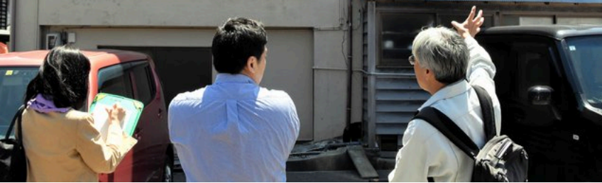
鉄筋コンクリート造と木造が合わさった住宅。木造側に傾きが生じていた=石川県輪島市

朝日新聞デジタル有料会員からプレゼントされた記事です。記事の利用は個人的な利用に限ります。 こちら の使い方を必ずご確認のうえご利用ください。