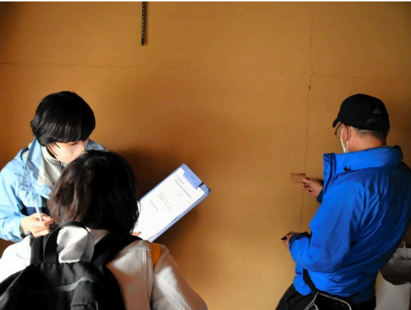
壁のひびの状態を調べる専門家ら=石川県七尾市

県の補正予算案には、地盤や建物の傾斜の修復費用への補助金も盛り込まれた。費用の3分の2近くを最大766万円まで出すという。(編集委員・佐々木英輔)