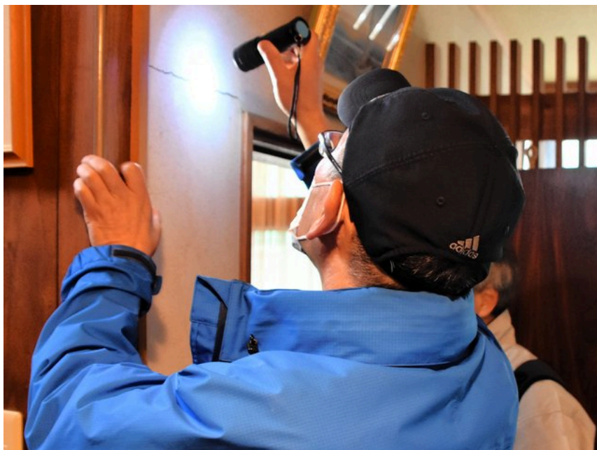
壁のひびの状態を調べる専門家ら=石川県七尾市

メンバーは、壁の素材、壁紙の状態やひびの大きさ、柱や床の傾き、部屋の寸法などを確認していった。手元には、各材料の損傷度合いと、地震で建物が変形した量との関係を示した対照表。これをもとに、建物がどれだけダメージを受けたかを判定する。