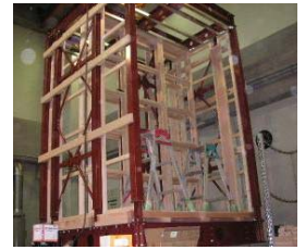
写真1 実験装置概観